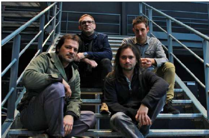
■ Les groupes locaux By'ce project et DEYT vont se produire sur la scène des Ateliers du cinéma.

Une semaine plus tard, vendredi 9 février, ce sera au tour du groupe DEYT (Destroy everything you touch) de se produire sur scène offrant aux specta-