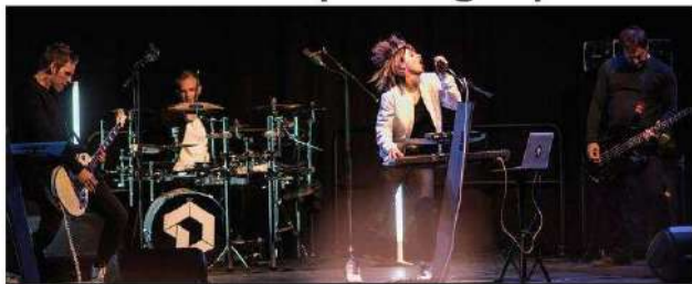
■ Le groupe Destroy everything you touch (DEYT) en live. Photo DR « Trashier photo »

« Détruis tout ce que tu touches. » Telle est la traduction française de Destroy everything you touch (DEYT), le nom du groupe san-rémois résident de l'Espace Florent-Pagny. La formation vient de sortir un cinq-titres dans la pure veine du bon son auquel elle nous a habitués.